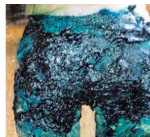
A probléma azonosítása és a PUTTY alkalmazása